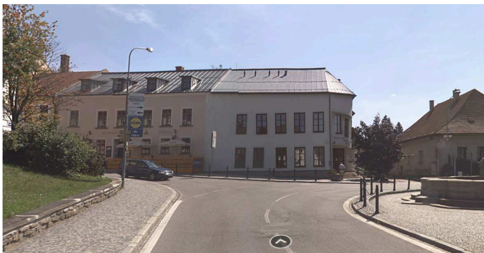
NMNM, MPZ – budova bývalé VZP, Palackého nám. čp. 16 a navrhované úpravy